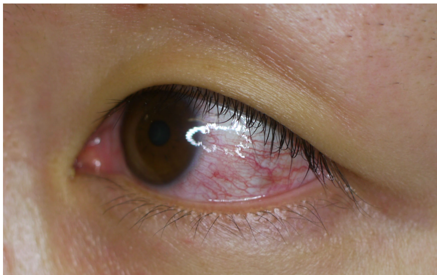
図4. ジカウイルス病の充血性結膜炎