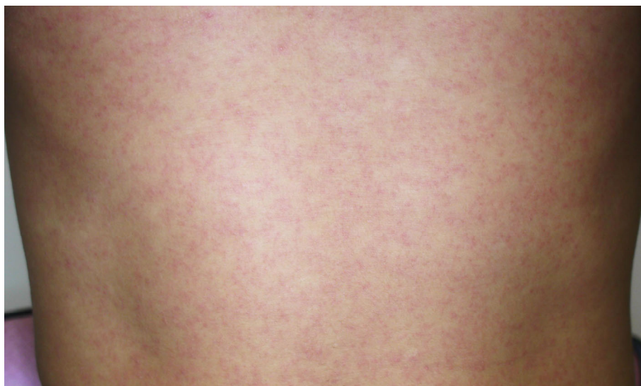
図3. ジカウイルス病の斑状丘疹様の発疹

潜伏期間は、2～12日（多くは2～7日）である。ジカウイルス病の臨床症状は多彩であるが、斑状丘疹様の発疹（ 図3 ）は90～100%に認められるのに対して、発熱の頻度は35～65%とされている 54,55 。また発疹は掻痒感を伴うことが多いとされている。また、大半の症例は入院を必要としなかった。 表7 に2015年のブラジル・リオデジャネイロにおけるジカウイルス病患者が発症後4日以内に認めた臨床症状を示す 55 。