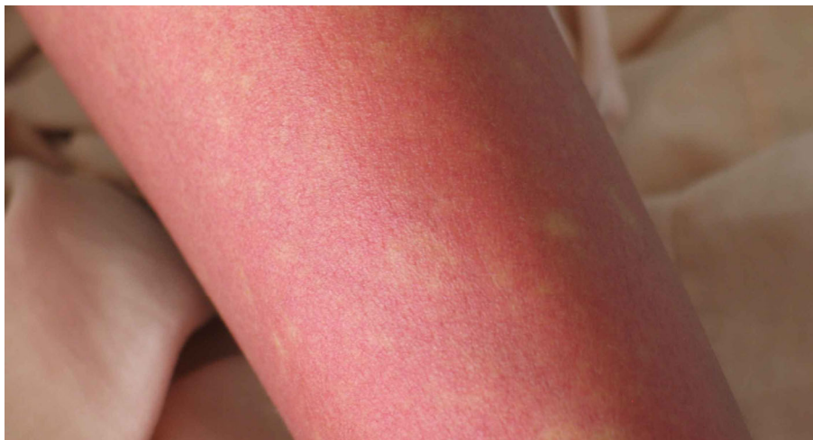
図 2. デング熱患者の発疹：解熱時期にみられた島状に白く抜ける紅斑