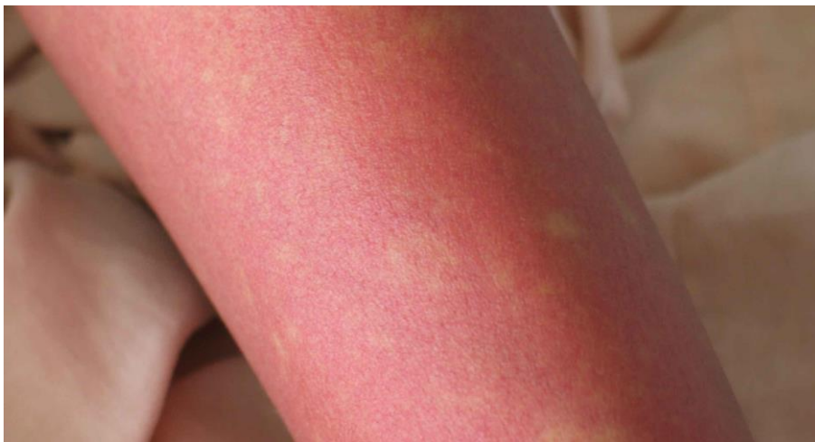
図 2. デング熱患者の発疹：解熱時期にみられた島状に白く抜ける紅斑