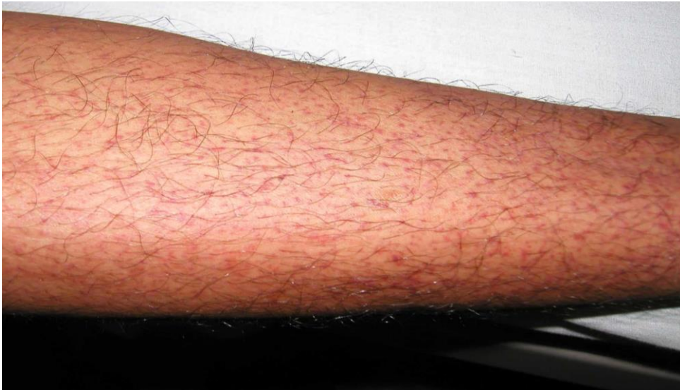
図 1. デング熱患者の発疹：解熱時期にみられた点状出血