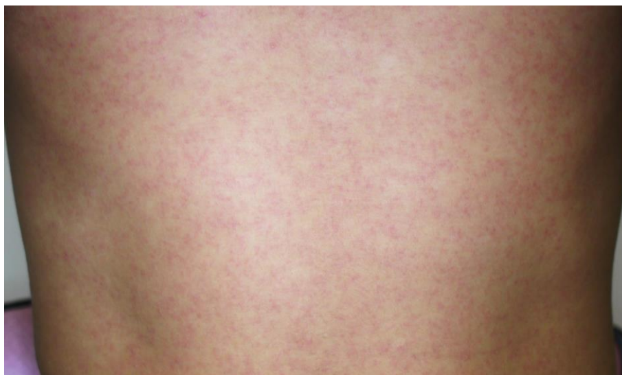
図3. ジカウイルス病の斑状丘疹様の発疹

潜伏期間は、2～12日（多くは2～7日）である。ジカウイルス病の臨床症状は多彩であるが、斑状丘疹様の発疹（ 図3 ）は90～100%に認められるのに対して、発熱の頻度は35～65%とされている 25,45,46 。また発疹は掻痒感を伴うことが多いとされている。また、大半の症例は入院を必要としなかった。 表7 に2015年のブラジル・リオデジャネイロにおけるジカウイルス病患者が発症後4日以内に認めた臨床症状を示す 45 。